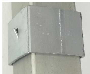
Scorrevolino per il filo