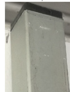
B. Particolare della sommità

RIGONE A MOLLA CON PEDALE 35X35 - 215-310